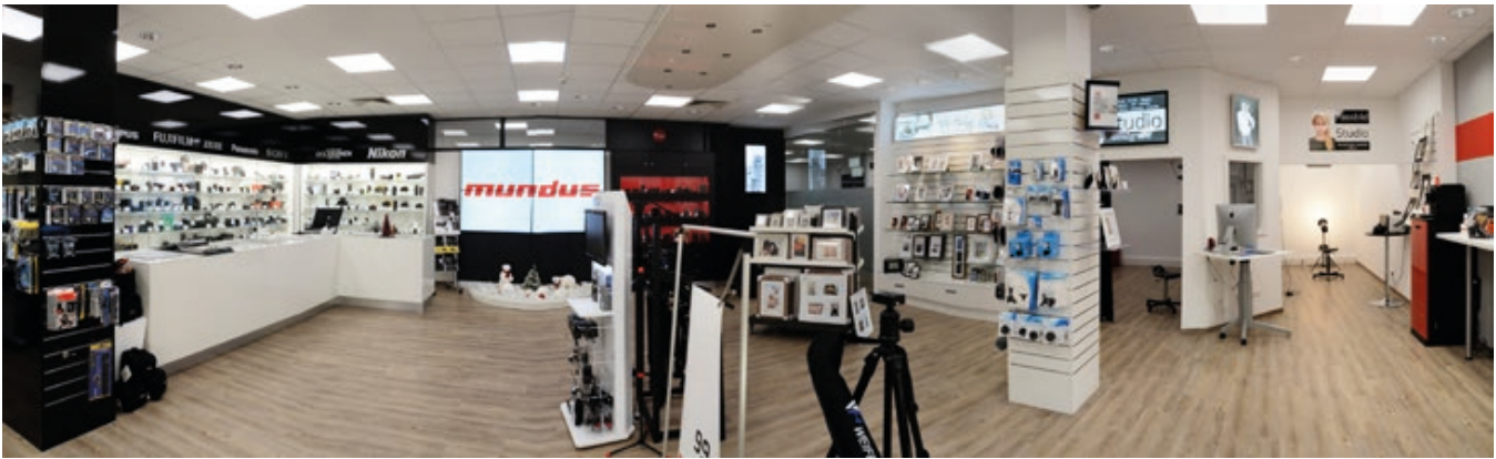
Foto Mundus setzt auf PayPal

Der Onlineshop von Foto Mundus in Meppen kombiniert persönliche Beratung und flexible Zahlung zum Erfolgsmodell – mit Vorteilen für Kunden und Händler.