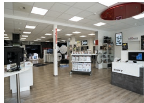
Marktführer: Foto Mundus gehört zu den bedeutenden deutschen Händlern im Foto-Bereich. Die Partnerschaft mit PayPal hat sich als zusätzlicher Vorteil erwiesen

Anfang 2017 kam mit „Ratenzahlung Powered by PayPal“ eine neue Möglichkeit dazu. Zudem führte Foto Mundus schon Mitte 2016 „PayPal PLUS“ ein. „Wir sind